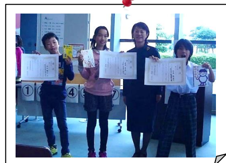
小学生の部チャンプの皆さん

ビブリオバトルとは... バトル(発表者)たちが、好きな本の魅力を制限時間5分間で紹介しあい、投票によって一番読みたくなった本「チャンプ本」を決める書評ゲームです。